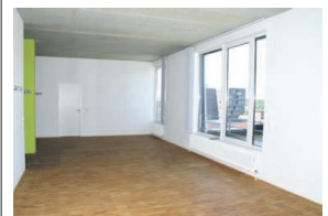
Derzeit noch im Umbau: Insgesamt 700 Quadratmeter Bürofläche werden im Port Vier den Coworkern zur Verfügung stehen